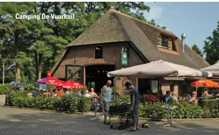
Camping De Vuurkuil