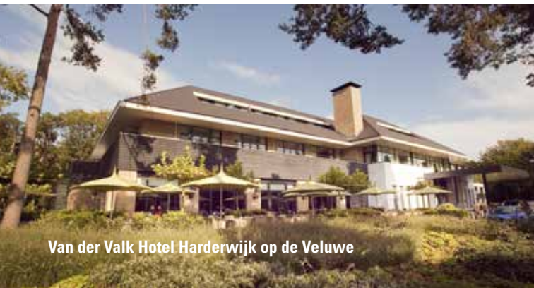
Van der Valk Hotel Harderwijk op de Veluwe

Opdracht Wat is de naam van het 200ha stuifzandgebied dat achter het hotel is gelegen?